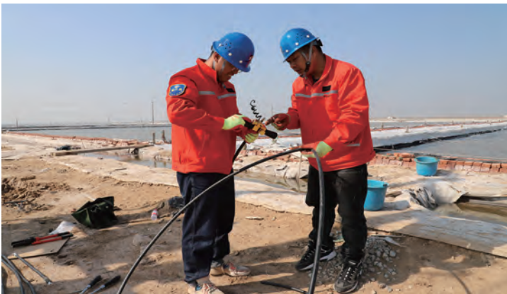
为保障日晒制盐公司春季盐业生产期间电网安全稳定运行,连日来,供电工程分公司灌西供电所抽调精干力量,全力投入到电力线路检修、整治工作中,全面提升线路的供电可靠性,为盐业春耕春收生产蓄势储能。(武文)

聚焦管理提升,全面激发经营管理活力。紧扣“基础管理提升年”活动主题,强化“向管理要效益”理念,狠抓基础管理提升,对标区域同行业先进企业或标杆企业,采取“走出去”方式,学习先进管理的典型经验和有效做法,帮助查找基层基础工作管理“短板”和薄弱环节,全面提升工作质效。上元公司坚持以问题为导向,深挖建材内潜降本增效,着力在责任落实上细化、考核评价上加压,为降本增效工作快速、有序推进发挥了导向性、引领性作用,加大“降成本、增效益”力度,拓宽降本增效空间。(顾卫远)