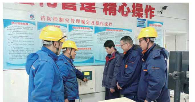
近年来,利海化工公司强化安全生产宣传教育,全方位组织开展安全环保知识培训、操作技能提升班、专家讲座、换岗实践等活动,进一步提高员工应知应会水平、应急处置能力和操作技能。图为“消防值班应答”培训。(顾孟 刘欣)

▲4月6日下午,徐圩投资公司开展职工代表巡视女职工权益保护专项活动,巡视组深入一线就女职工产假、生育待遇、禁忌劳动保护、五期保护等权益保护情况进行巡视,充分发挥女职工代表参与企业日常民主管理、民主监督的权利。(陈健 茆莹)