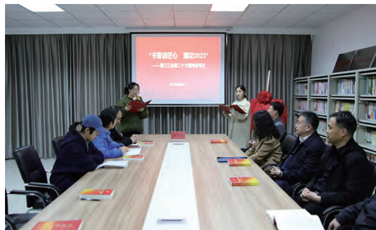
为推动青口投资公司职工阅读活动深入开展,打响“书香青投”读书品牌,4月6日,青口投资公司工会举办“青稻穗”读书社揭牌仪式暨“书香润匠心·建功2023”送二十大精神进书社活动。(段绪雯)

“三组联建”开展以来,该党委大力实施政治强心、党建强基、人才强企、廉政强身、和谐强本“五强工程”,28个班组全年开展“三组联建”活动600多次,奋力推动实现“企业不亏损、职工不下岗”目标,党建引领高质量发展迈出坚实步伐。(北宣)