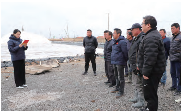
为持续掀起学习宣传贯彻党的二十大精神热潮,连日来,灌西投资公司党委深入开展“二十大宣讲基层行”系列活动,围绕“二十大报告一起学、基层党员话发展”主题,通过微型党课、实景宣讲、交流研讨的方式,将新思想、新理论带到盐田滩头等基层一线。(许东彦)