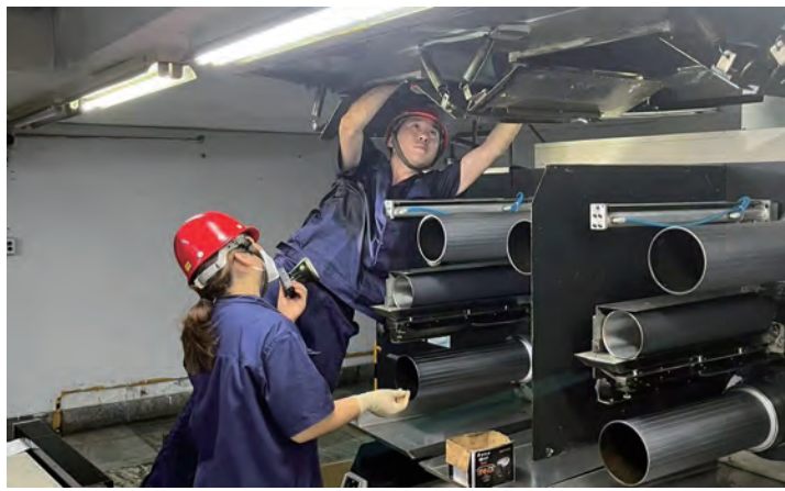
日前，氨纶公司 2023 年度大修工作拉开序幕，涉及维修项目 200 多项，各生产班组层层分解任务，挂图作战，倒排工期，确保如期保质保量完成大修任务。