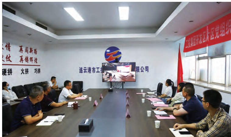
为认真贯彻落实党的二十大精神,创新基层党建工作载体,提高基层党建工作水平,8月30日下午,由台北投资公司牵头,举行开发区片区党组织党建研学暨共建协议签订仪式,并集中观看《党课开讲啦》党史学习教育系列特别节目。(北宣)